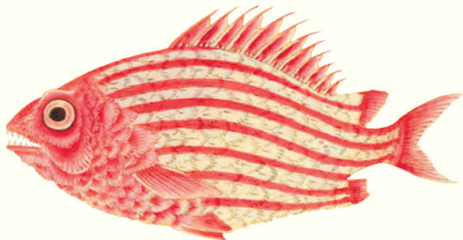
Sargocentron spinosissimum イトウダイ 一刀鯛 North Pacific squirrelfish イトウダイ科

近世の西洋では、中国の金魚とともに東洋の美しい鑑賞魚として紹介された。沖縄では食用とされる。ただし鱗が硬く、料理するのに手間がかかる。