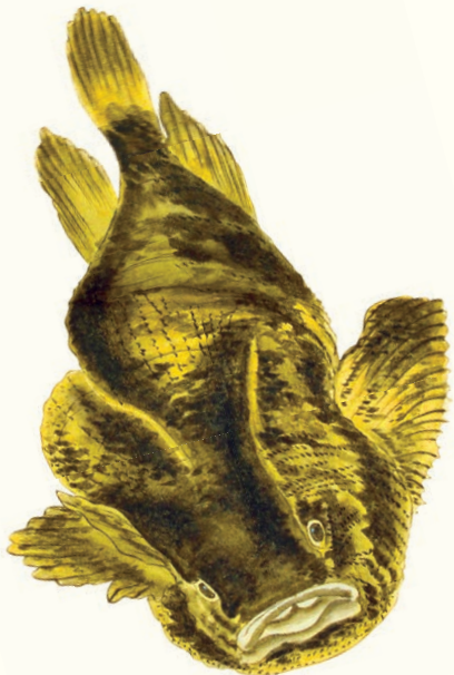
Aptocyclus ventricosus ホテウオ 布袋魚 Smooth lumpsucker ダンゴウオ科

福神の布袋様の体形を思わせることが、名の由来。ゴッコとも呼ばれ、北海道名物のゴッコ汁は、ホテウオの皮を剥ぎ、しょう油で煮たもの。肥料にも利用される。